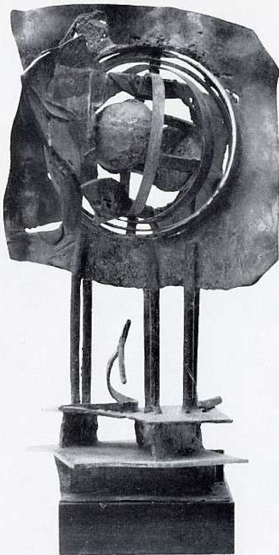
IL TEMPO - BRONZO - 1970