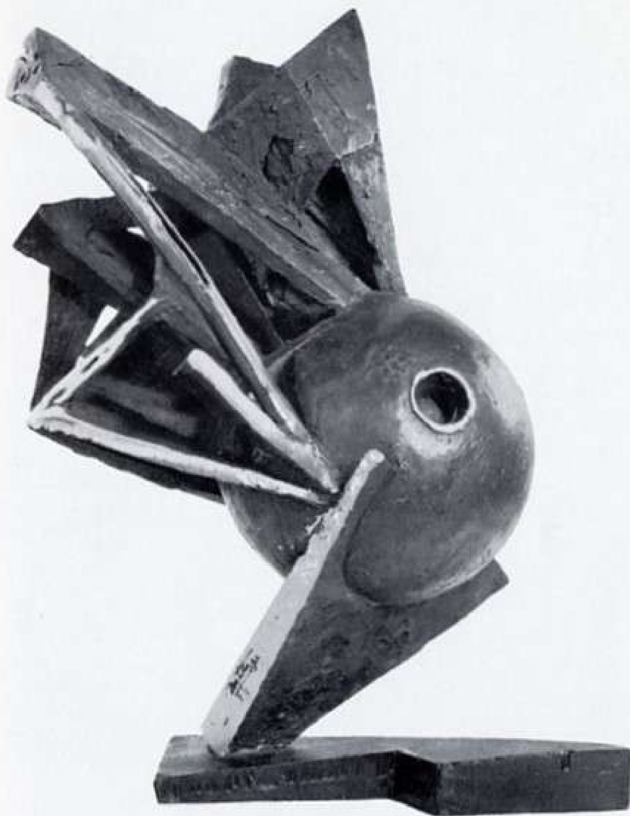
DER KÖNIG - BRONZO - 1968