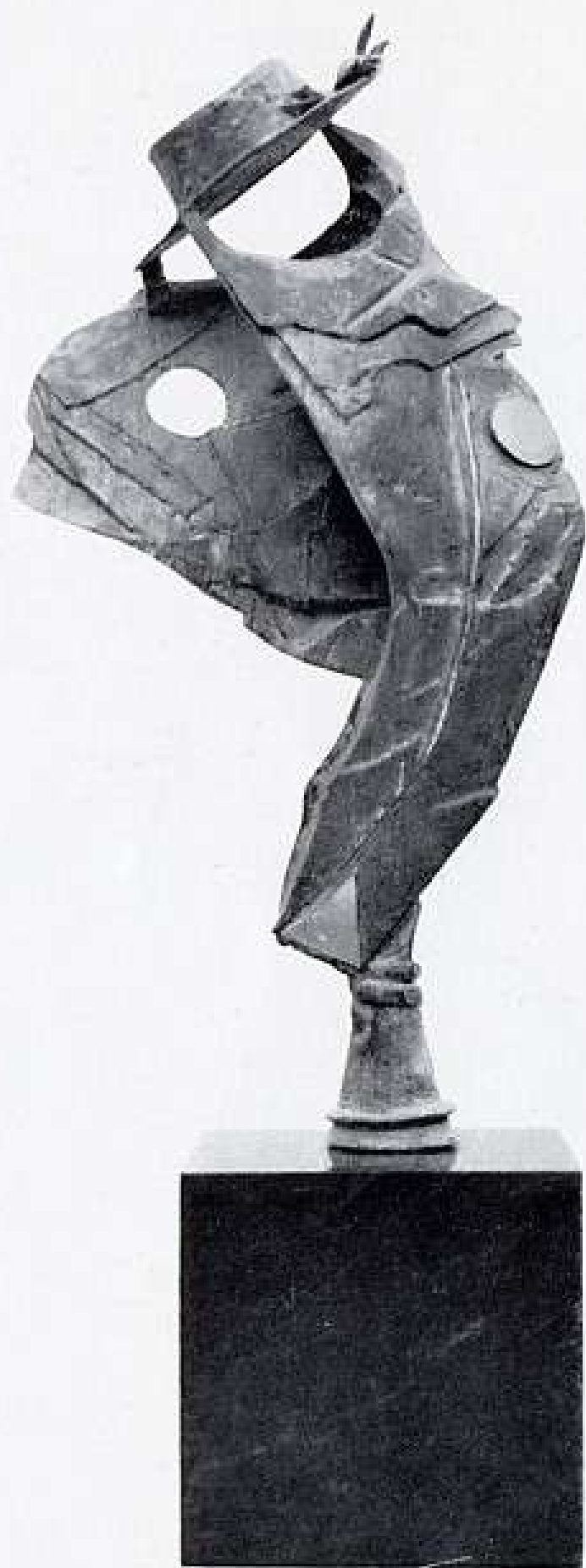
LA PAZZERELLA - BRONZO - 1970